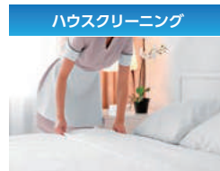
ハウスクリーニング