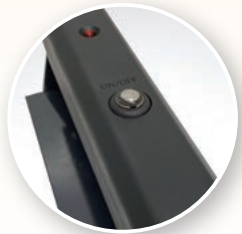
スイッチを押している間は安全に加熱します