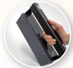
AC100V仕様 出張作業でも大活躍