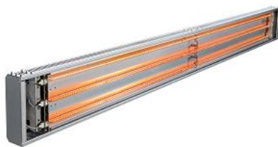
長尺加熱器(3mまで可能)