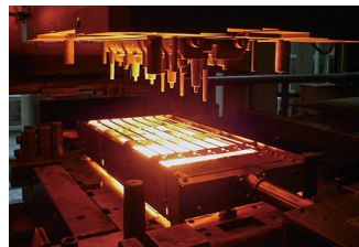
ハイパワー金型加熱器