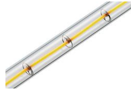
コルチェヒーター