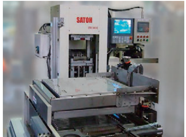
CF-1 とプレス装置との組み合わせ例

高出力赤外線カーボンヒーター(オレンジヒート ® )は、起動すると約1秒で所定の出力に達します。必要なタイミングでヒーターを瞬時起動して加熱することができるため必要な時に必要な量だけ製品を生産することも可能です。