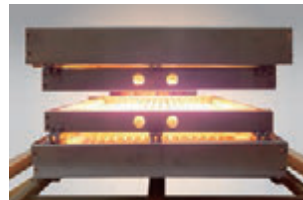
発熱部：長さ 470mm × 幅 700mm