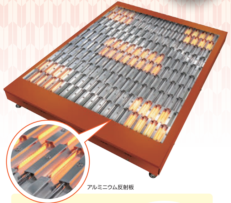
アルミニウム反射板