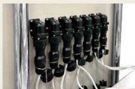
ワンタッチコネクタでヒーター着脱