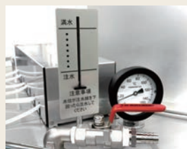
水位計・水温計・給水バルブ